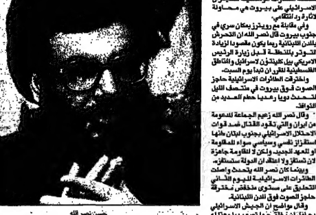
بيروت من جاك ودين